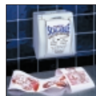
Optionale Halterung für Wandmontage